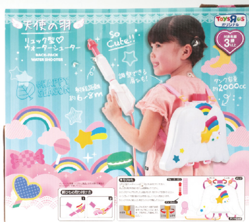
日本トイザラス(株)天使の羽リュック型ウォーターシューター商品・パッケージデザイン