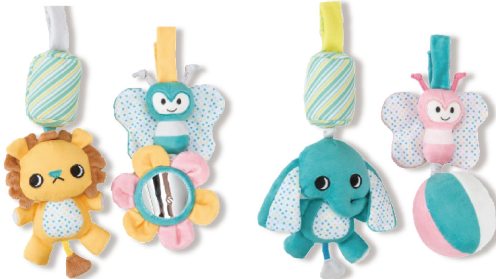
日本トイザラス(株)やわらかラトル&チャイム