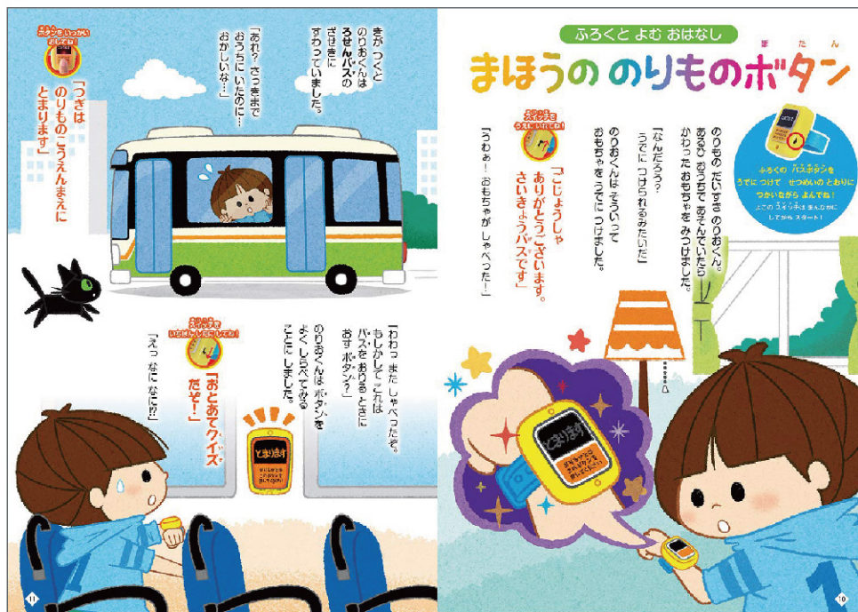
(株)学研プラス 学研ムック のりものイチバンよみものページイラスト