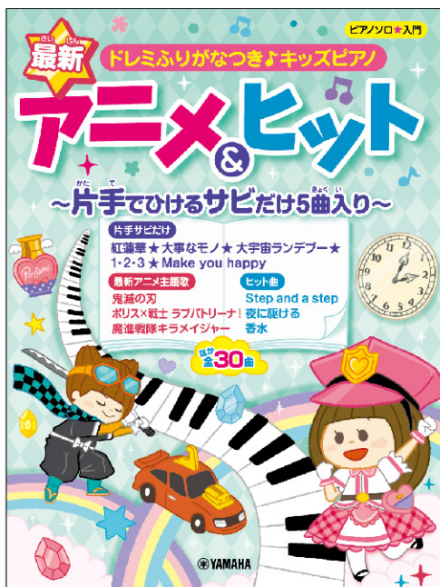
(株)ヤマハミュージックエンタテインメント「今弾きたい!ピアノ初心者のためのベストヒット」表紙イラスト/デザイン 「ピアノソロ ドレミふりがなつきよキッズピアノ最新アニメ&ヒット」表紙イラスト/デザイン