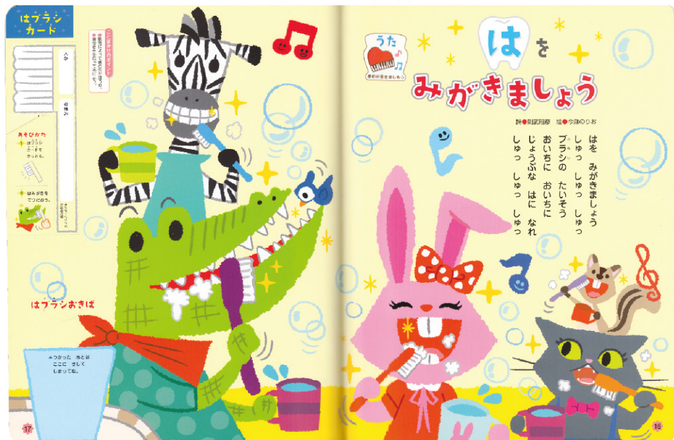
(株)フレーベル館「キンダーブック2」6月号中面はみがきページイラスト