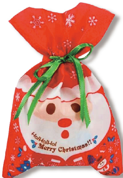
日本トイザラス(株) サンタ柄クリスマスギフトバッグ